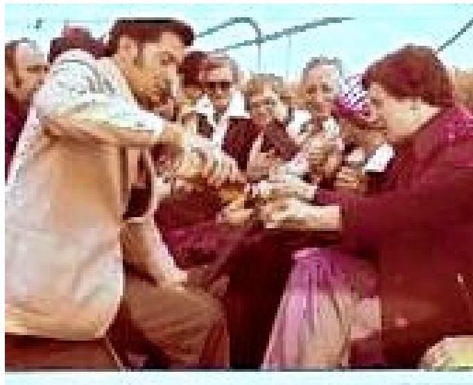
Eindruck vom Sommerfest Langenhorn 1982.