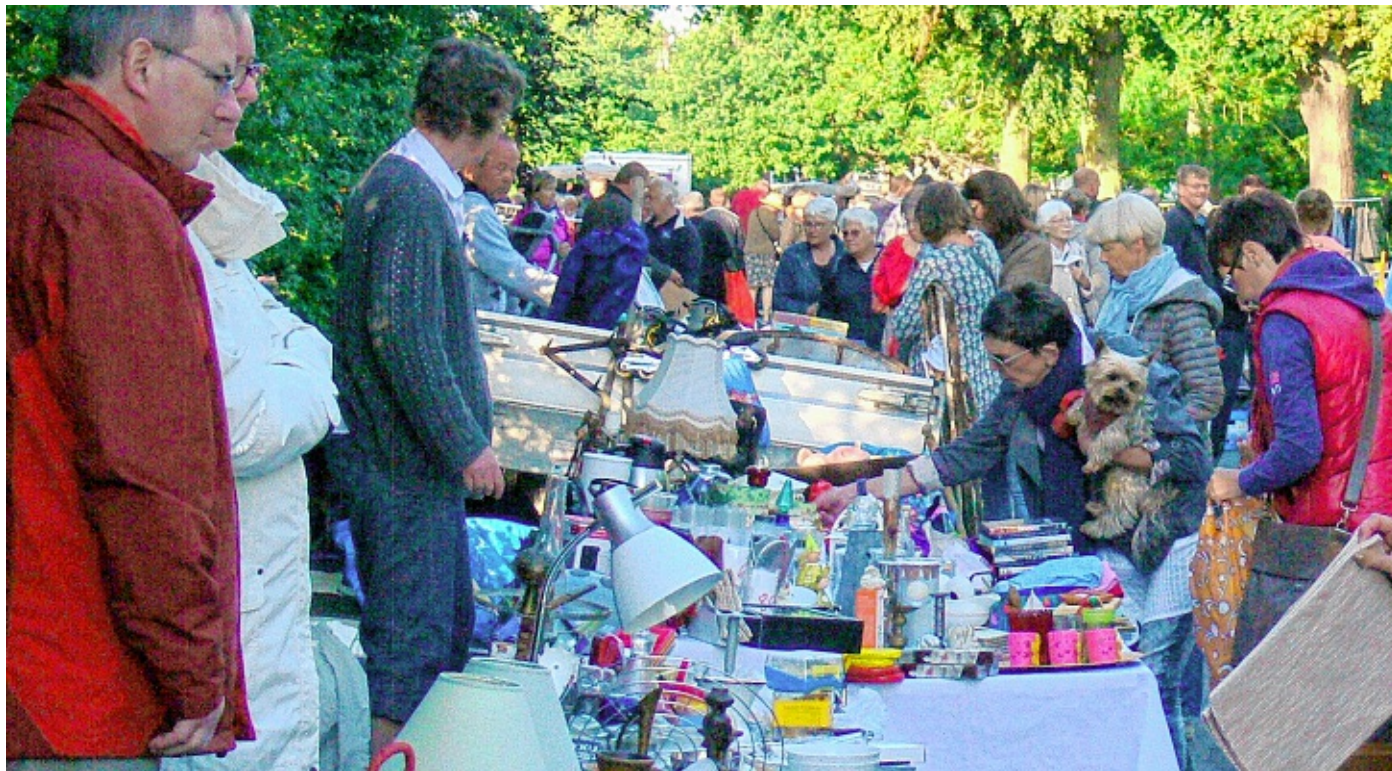
Sehr beliebt ist der unendlich lang erscheinende Flohmarkt entlang der Dorfstraße.