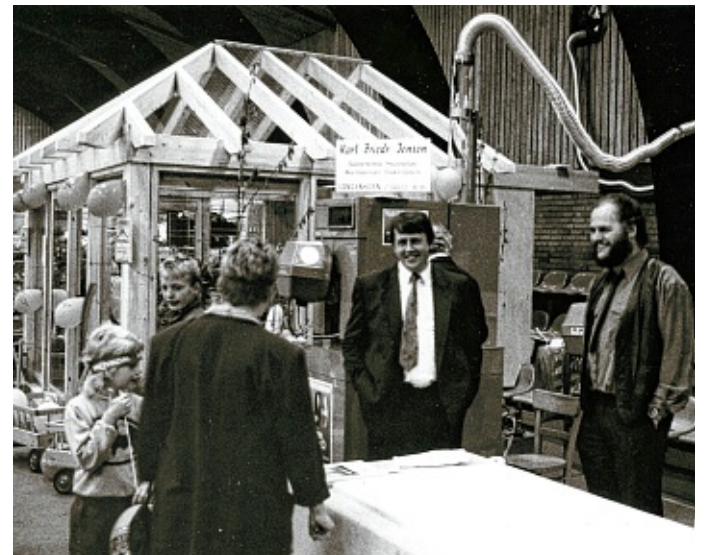
Die Gewerbebesse Langenhorn aus dem Jahre 1990.