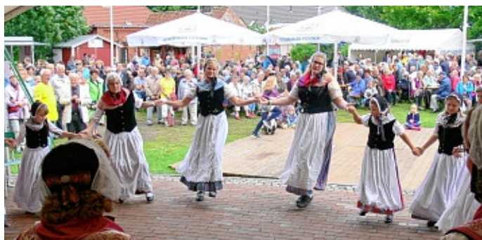
Immer ein Hingucker: die Trachtentanzgruppe.