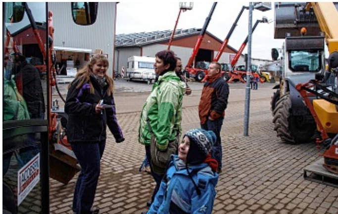
Immer ein Ereignis, die Langenhorner Messe, hier aus dem Jahr 2013.

Über 300 handschriftlich beschriebene Seiten umfasst das erste Protokollbuch des Gewerbevereins, das seit 1994 voll ist. Auch der Folge-